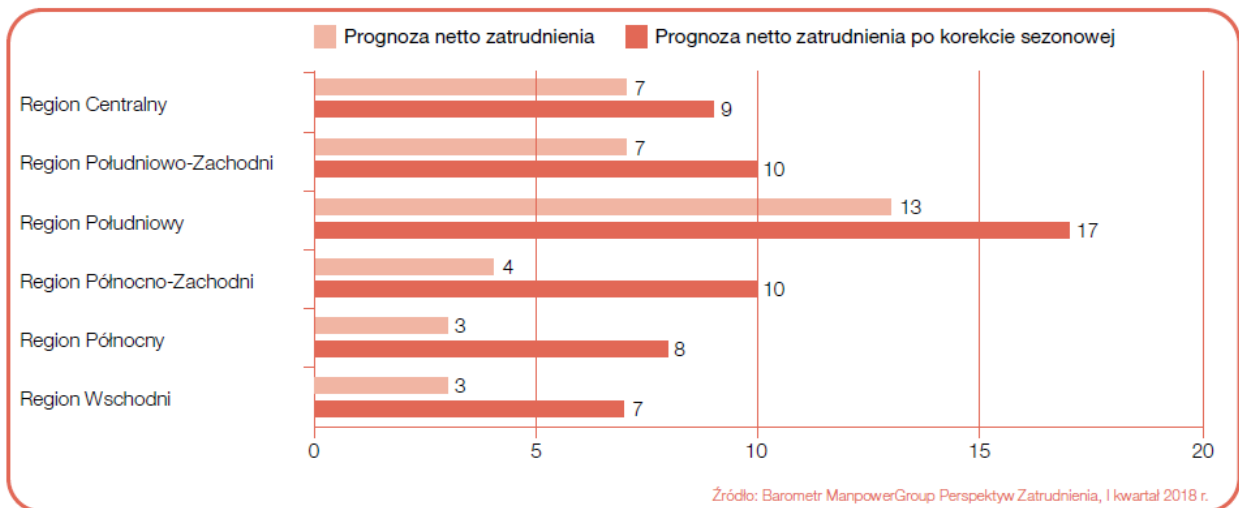
Wykres 3. Prognoza netto zatrudnienia dla regionów Polski na Q1 2018 r.; podział wg Eurostat.

We wszystkich sześciu regionach w okresie styczeń-marzec przewidywany jest wzrost zatrudnienia. Największego wzrostu wskaźnika spodziewają się pracodawcy w regionie Południowym, którzy deklarują prognozę netto zatrudnienia na poziomie +17% . W dwóch regionach, Północno-Zachodnim i Południowo-Zachodnim odnotowany jest umiarkowany optymizm pracodawców na poziomie +10%, podczas gdy prognoza zatrudnienia w Polsce Centralnej wynosi +9%. Najmniejszy optymizm cechuje pracodawców na Północy i Wschodzie, gdzie prognoza zatrudnienia jest na poziomie odpowiednio +8% oraz +7%. W porównaniu do ostatniego kwartału 2017 r. prognoza pogorszyła się w trzech z sześciu regionów, w tym w regionie Wschodnim i Południowo-Zachodnim, gdzie odnotowano lekki spadek o 2 punkty procentowe. Jednakże pracodawcy w regionie Południowym deklarują znaczną poprawę o 9 punktów procentowych, a prognoza dla regionu Północno-Zachodniego wzrasta o 3 punkty procentowe.